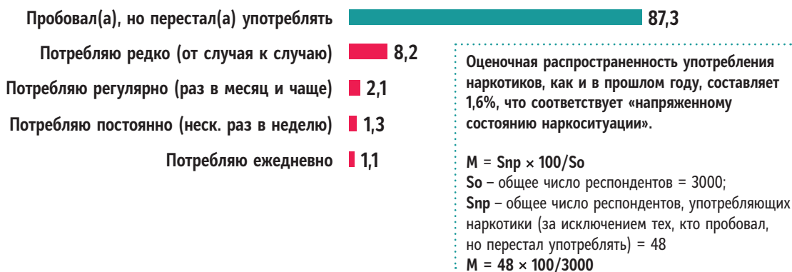
Рис. 2. Распределение ответов респондентов на вопрос: «Как часто вы употребляете наркотики?», %

Большинство их тех, кто пробовал наркотики (12,6% от общего числа жителей края), к настоящему времени перестали их употреблять – 87,3%, то есть, подавляющее число граждан, имеющих опыт употребления наркотических веществ, относятся к подгруппе случайных потребителей наркотиков. Доля актуальных потребителей составляет 12,7%.