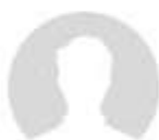
РИС УО ПК